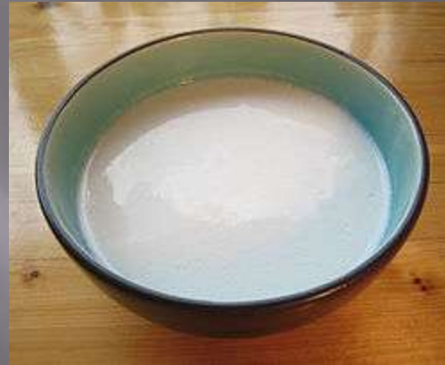
Leche de coco